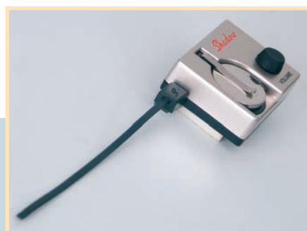
Einfacher Einbau und luftiger Klang: Shadow NFX-AC